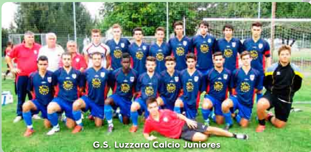
G.S. Luzzara Calcio Juniores