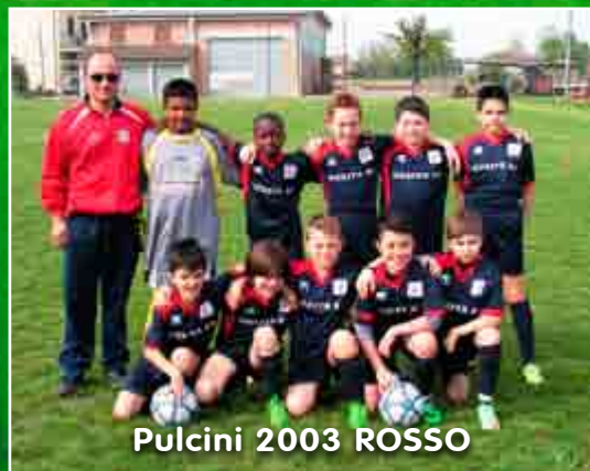
Pulcini 2003 ROSSO