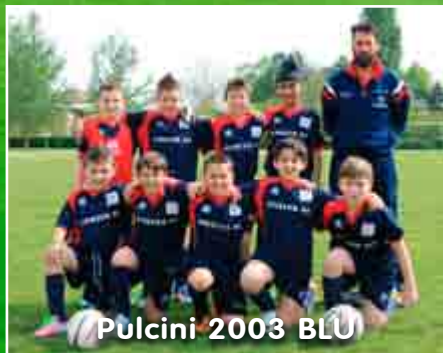
Pulcini 2003 BLU